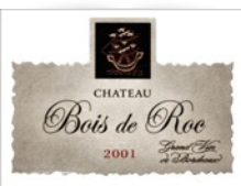
Ch.Bois de Roc