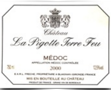
La Pigotte Terre Feu