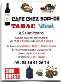
Bar Chez Sophie