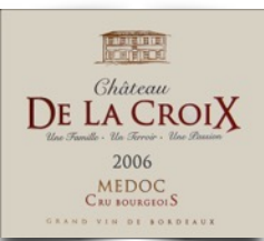
Ch.De la Croix